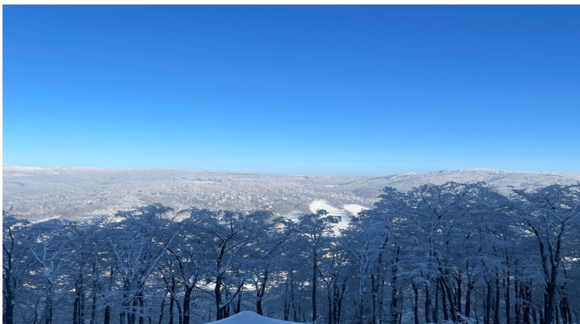
Widok w kierunku wschodnim z górnej Stacji Kolei linowej Czantoria